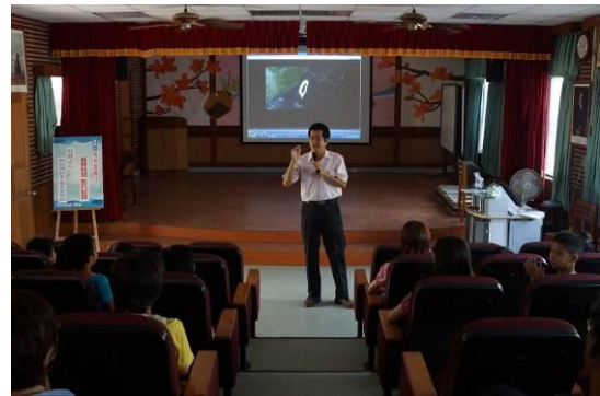
教導主任致詞感謝新台灣基金會贊助「看見台灣」公播版予本校