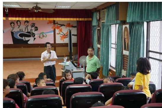
說明：反思回饋與學生分享