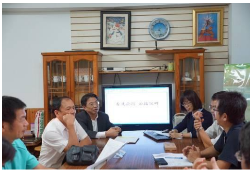
經驗交流與意見交換