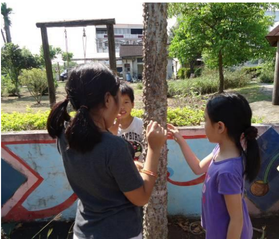
尋訪社區裡的木棉樹