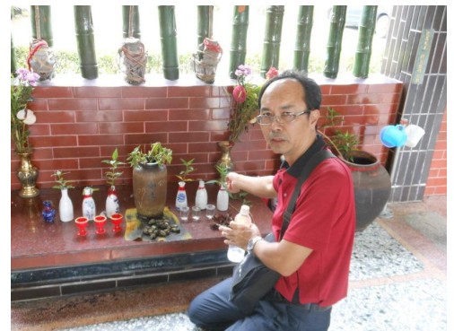
吉貝耍居民行三向禮，以米酒、檳榔向阿立母表示敬意