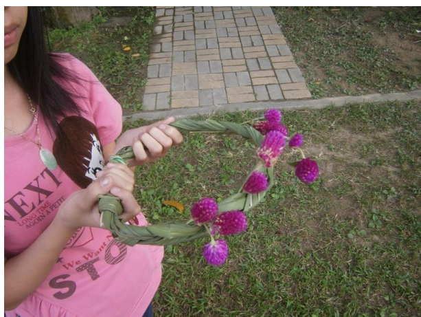
小朋友做的 Ha-lau，功力可不輸給大人。