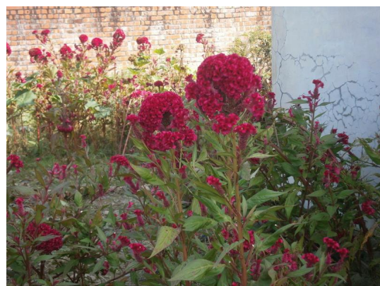
雞冠花裝飾在 Ha-lau 上，具有感恩的意義。