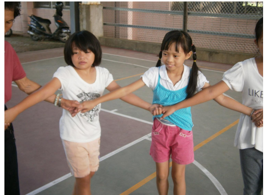
本班同學參加夜祭牽曲練習。