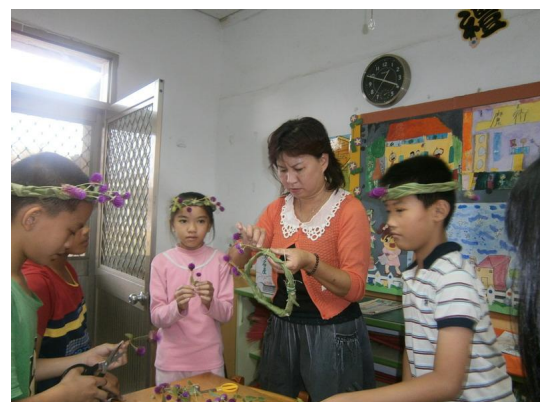
師母也加入指導的行列，原來師母的技巧比老師更厲害。