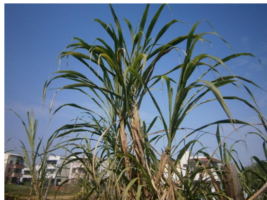
甘蔗葉是編製 Ha-lau 的主要素材。