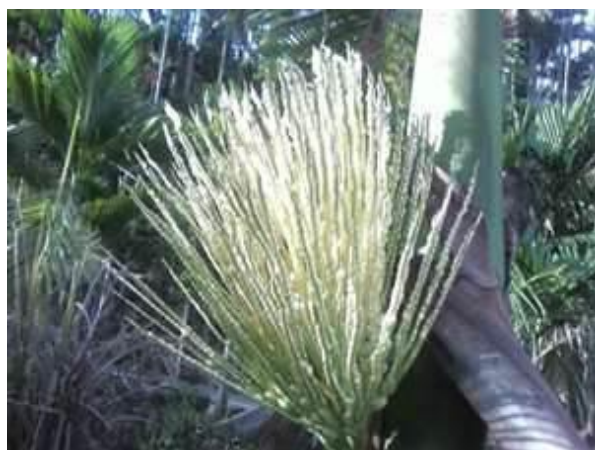
檳榔是祭祀阿立母的主要祭品，檳榔花裝飾 Ha-lau 別具意義。