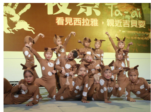
我們還表演了「森林中的精靈」。

「拜豬還願」是夜祭中的第一項儀式，因為向阿立母祈求當兵的孩子平安歸來或事業有成後用來表達感謝和敬意