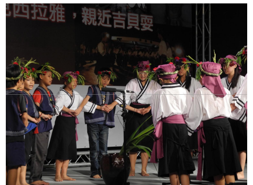
參加晚會牽曲表演。