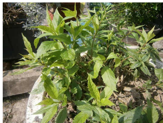
澤蘭，西拉雅語叫做「伊興」，是族人的平安符。