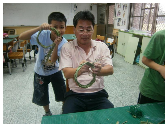
老師親自示範編製 Ha-lau 的方法。