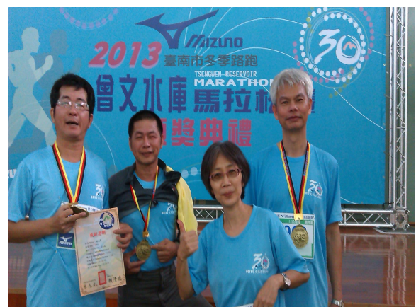
校長和老師報名參加各地的路跑賽