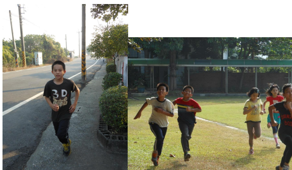
學生在校內校外練習跑步