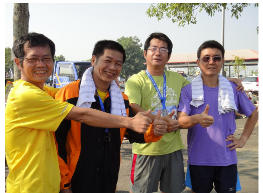
校長和三位老師參加 2013/10/27run Fall fun-2013 台南市秋季路跑後合影

西拉雅族是善跑的原住民族，善跑的青年稱為麻達(Mata)。吉貝耍的校長和老師自 2011 年接觸慢跑活動後，深刻體會慢跑能為自己的健康加分，在體育課程中帶領學生參與慢跑，且校長發起的「跑出一間圖書室」後，慢跑的風氣逐漸在吉貝耍國小蘊開。師生無論在校園或是放學後，能自主學習或是參加各種慢跑活動，如 2013/18 台東利吉惡地超馬、2013/10/27run Fall fun-2013 台南市秋季路跑、2013/12/8 曾文水庫國際馬拉松賽、2013/12/15 紅瓦厝保生盃馬拉松等。