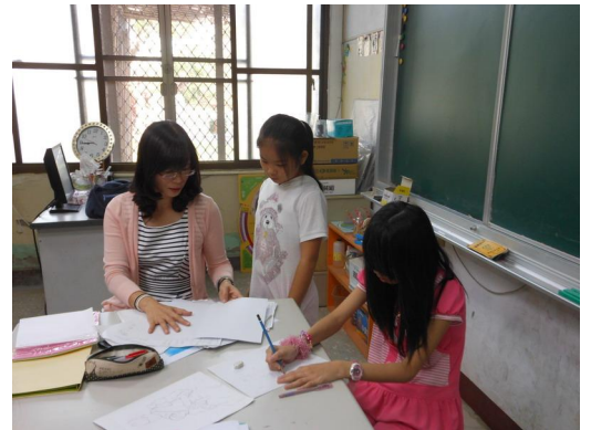
老師指導學生繪製以西拉雅語為主的語花小書

老師利用午休與晨光時間指導學生製作語花台繪本。老師首先必須教導學生認識語花詞彙中的各民族特色，再以資訊融入、直接講述以及活動教學的方式讓學生了解。然後老師指導學生發揮創意製作繪本內頁，並指導學生實際製作，並將優秀作品送參加語花小書比賽。同時擷取整合優良畫作帆布輸出，做為西拉雅語教學情境佈置。