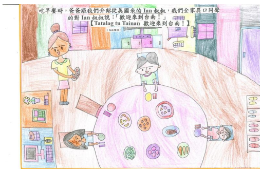
中年級學生的作品