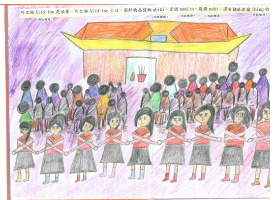
學生畫出在夜祭時大公界的牽曲儀式