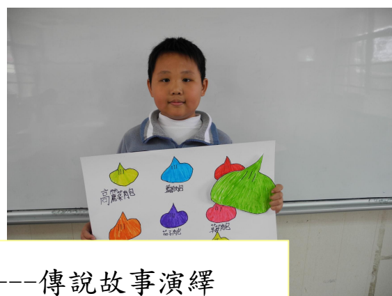
學生拿著自己製作的道具(肉包攤子)拍照。