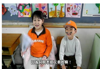
劇情內容—學生扮演說書人，向同學講述故事的啓示。