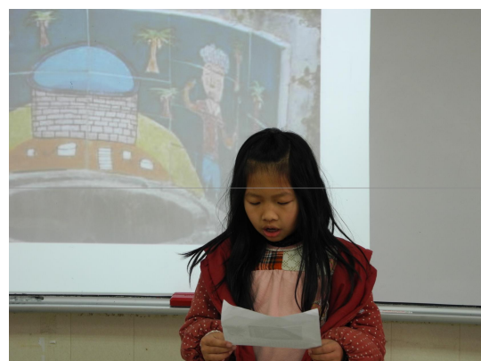
學生專注地練習台詞，站上台大聲念給同學們聽。