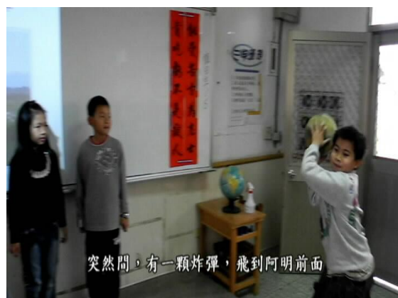
劇情內容—突然間，有一顆炸彈飛到阿明面前！