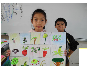
學生拿著自己製作的道具(農田)拍照。