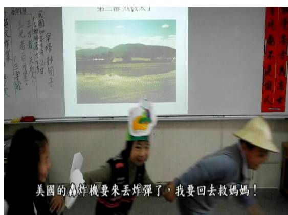
劇情內容—轟炸機來吉貝要放炸彈了，有危險，大家趕快逃啊！