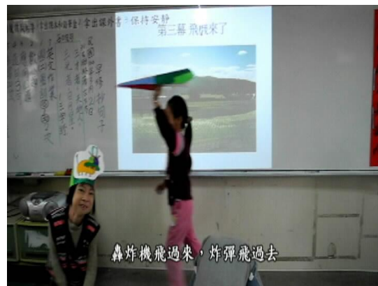
劇情內容—轟炸機從阿明和牛牛的頭上飛過去！

古老的傳說故事流傳到現在，是因為長輩們用心的保存，才能一直傳承下去不會消失，所以我們也要學習社區的長輩，好好為保護社區的文化盡一份心力。演這部戲也讓我學到團隊合作，不但要把自己的事做好，每位同學還要互相幫忙，大家也學習到阿明的孝順、乖巧和勤勞，因為這部戲我們全班學習到很多。